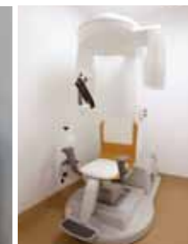
炭酸ガスレーザー 歯科用レントゲン