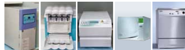
ホルホープ (ガス滅菌器) クアトロケア (自動注油洗浄器) スティティム (高圧蒸気滅菌器) Lisa (高圧蒸気滅菌器) ミーレジェットウォッシャー (洗浄・消毒器)

使用器材の衛生管理のため、洗浄・消毒に関する国際規格 (ISO15883) に基づいた高度な洗浄・消毒や、高い安全性を追求した滅菌システムを採用しています。