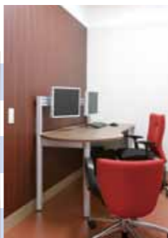
カウンセリングルーム