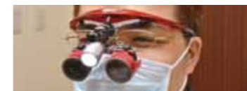
LED 照明付歯科用双眼ルーベ *全スタッフが所持しています。

※歯が欠けたり失われたりした場合に、かぶせ物、差し歯、ブリッジ、入れ歯(義歯)、インプラントなどの人工物で補い、機能・審美を回復することを専門とし、学会で認められた歯科医師です。 社団法人日本補綴歯科学会 http://www.hotetsu.com/p1.html