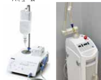
ピエゾン マスターサージェリー (超音波振動外科手術器)