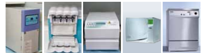
ホルホープ (ガス滅菌器) クアトロケア (自動注油洗浄器) スティティム (高圧蒸気滅菌器) Lisa (高圧蒸気滅菌器) ミーレ ジェットウォッシャー (洗浄・消毒器)

使用器材の衛生管理のため、洗浄・消毒に関する国際規格 (ISO15883) に基づいた高度な洗浄・消毒や、高い安全性を追求した滅菌システムを採用しています。