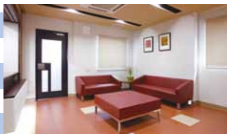
ロビー カウンセリングルーム