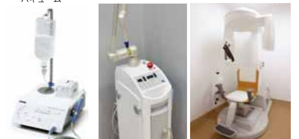
ピエゾン マスターサージェリー (超音波振動外科手術器)