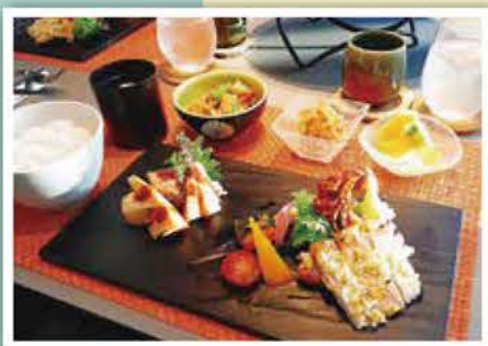
夕食(豚肉のねぎ塩焼き・鱈のソテー味噌風味 他)

おからの回復ぐあいはいかがですか？ 赤ちゃんのお世話はいかがですか？ とくに新米のママさんはめまぐるしい大変な一日だったかも…。 夕食の時間は、一日を振り返りながら、ほっとしていただけるそんな時間ではないでしょうか。 お疲れが緩み、思わずお顔に笑みが浮かぶような「お食事」となれば幸いです。