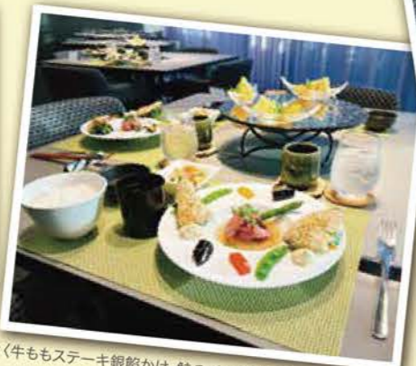
夕食(牛ももステーキ銀箔かけ・鮭のパン粉焼きタルタルソース添え 他)