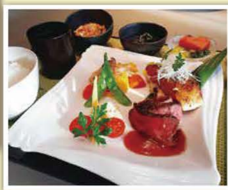
夕食(牛肉のステーキアメリカンソース・鱈の幽庵焼き 他)