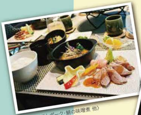
夕食(ローストポーク・鱈の味噌煮 他)