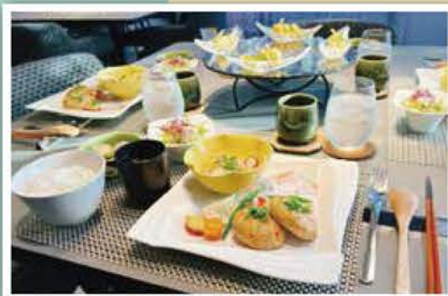
夕食(鶏つくね・カレーのおろし船かけ 他)