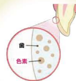
黄色に見える状態