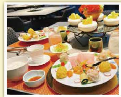
夕食(三色シュウマイ・帆立のチリソース 他)