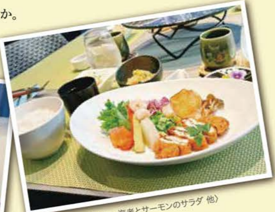
夕食(チキン梅しそカツ・海老とサーモンのサラダ 他)