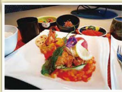
夕食(チキン南蛮・海老の香草パン粉焼き 他)