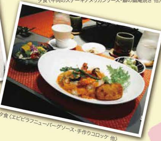
夕食(エビピラフニューバーグソース・手作りコロッケ 他)